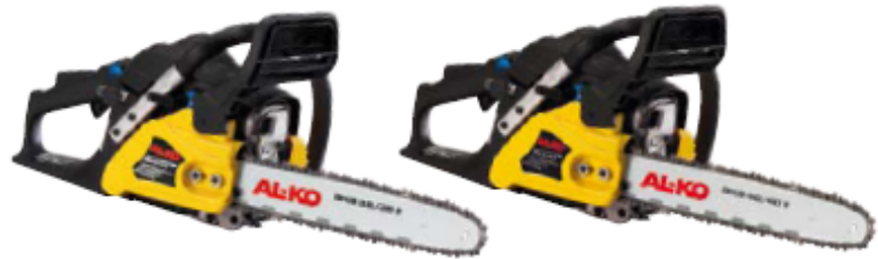
BK9 35/35 II